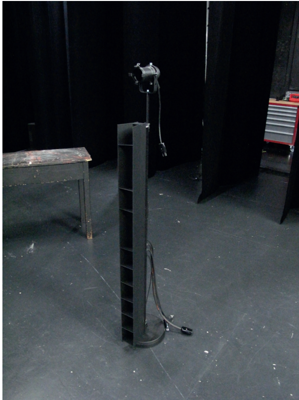
Montage FLUO et PAR16 sur pied de micro droit, embase ronde