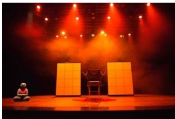
Création 2018, Les Faiseuses d'Anges , opéra – Décor Valérie Letellier

Association pour la promotion de l'art lyrique suisse sur scène ou via tout autre média, en Suisse et à l'étranger, en favorisant sa production, sa réalisation et sa diffusion auprès de publics (et jeunes publics) nationaux et internationaux. Domiciliée dans le canton de Genève et dirigée par Valérie Letellier, l'association met l'accent sur les nouvelles créations dans l'objectif de promouvoir l'expression d'un art en adéquation avec le monde contemporain. Déjà co-productrice en 2018 de La Citadelle de Verre , Les Faiseuses d'Anges et Shéhérazade, procès d'une infidèle en 2020, l'association produit en 2022 La Passion selon Marie suivi du Serpent Blanc dans la saison 2022-2023, 5 ème spectacle d'opéra produit ou coproduit sous cette raison sociale.